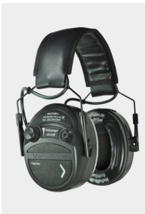
SILENCER Plus *)